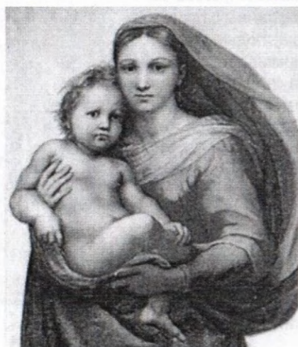
«Мадонна Темпи» Леонардо да Винчи